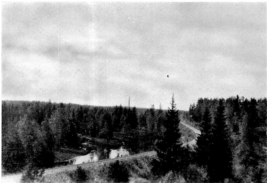
Från linjen Älgshultsby—Säfsjöström.