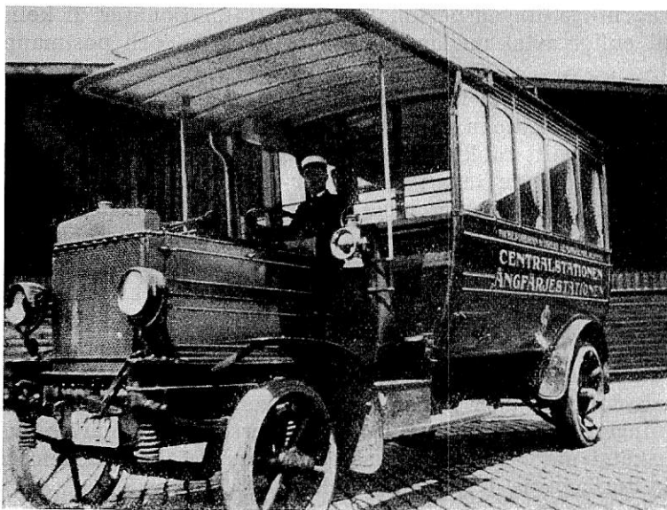
Bild 1. Med denna 32-hästares buss av fabrikat Büssing startade SJ 1911 å sträckan Tanum-Grebbestad sin första busstrafik. När denna linje nedlades 1915, flyttades bussen till Malmö för att ersätta den hästomnibus, som dittills befordrat resenärer till och från Köpenhamnsfärjan.

Jag nämnde inledningsvis, att när statens järnvägar 1921 startade sin första egentliga busstrafik, var det närmaste upphovet till denna trafik ingen av de faktorer, som, företagarmässigt sett, eljest brukar ge anledning till anordnandet av dylik trafik.