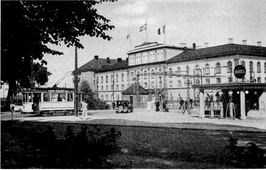
Stora Hotellet, Jönköping.