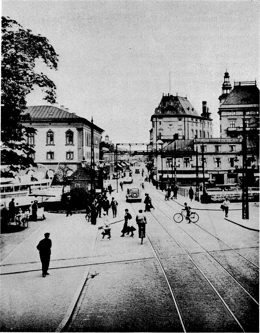
Östra Storgatan, Jönköping.