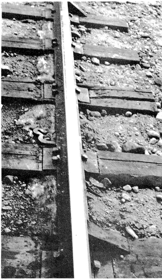
Bild 13. Detalj av samma rälssträng som i bild 10 söder om kmp 346+826