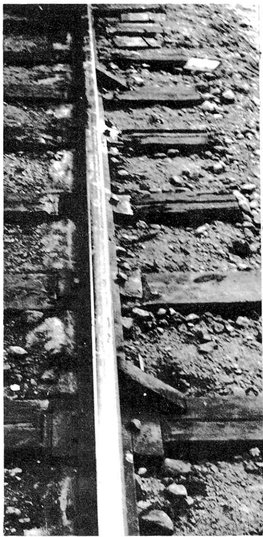
Bild 12. Detalj av samma rälssträng som i bild 10 norr om kmp 346+826